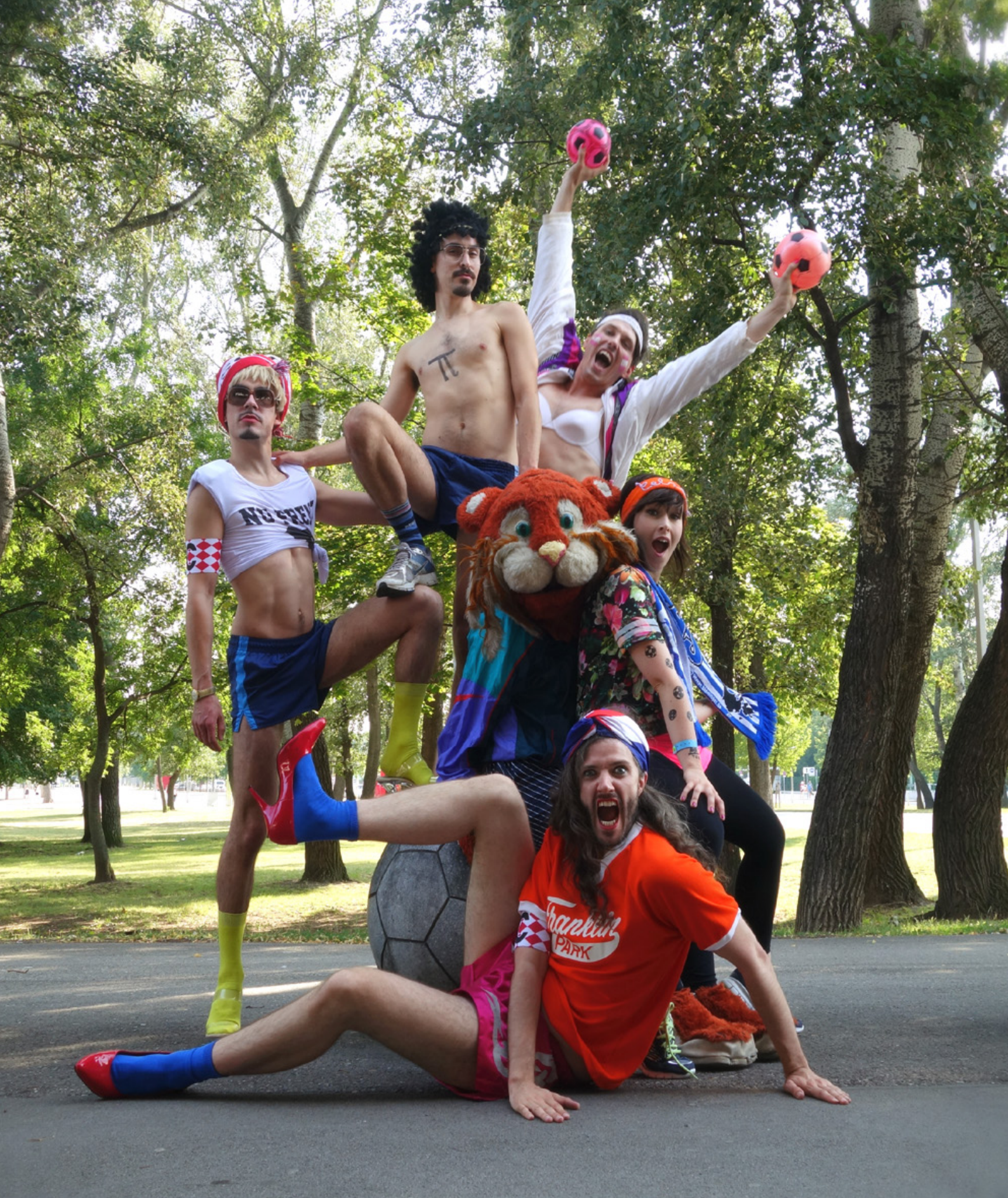
HOTEL BUTTERFLY „Hotel Butterfly – Football Playground“, Schikaneder, Vienna 2014