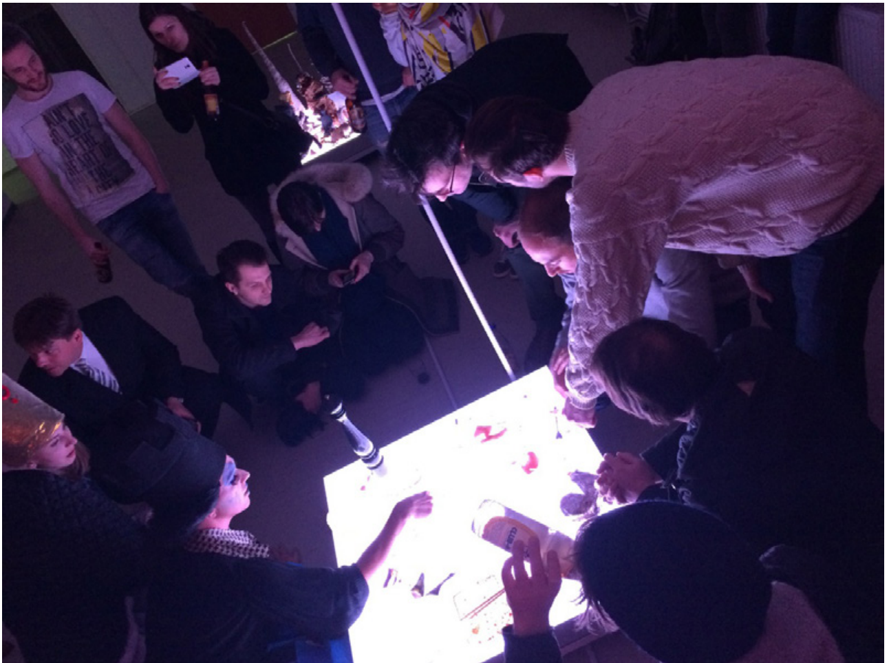
„Proudly Connected: Baer | Hotel Butterfly, Schachmatt“ installation/ performance FRIDAY EXIT, Vienna, Austria 2015