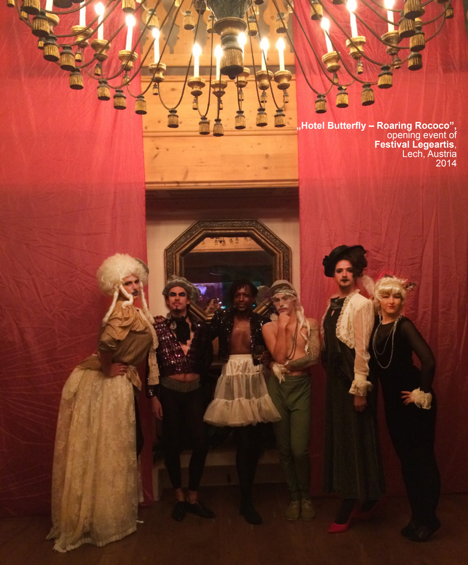
„Hotel Butterfly – Roaring Rococo”, opening event of Festival Legartis, Lech, Austria 2014