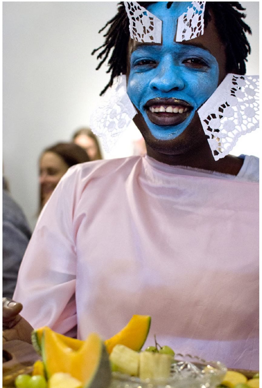
installation/ performance during the exhibition „Göttliche Liebschaften“ VBKÖ Austrian Association of Women Artists, Vienna 2014